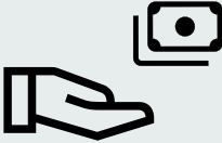
Kişisel Mali Sorumluluk